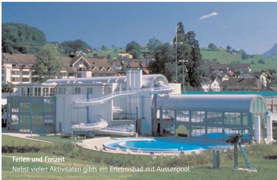
Ferien und Freizeit Nebst vielen Aktivitäten gibts ein Erlebnisbad mit Aussenpool.