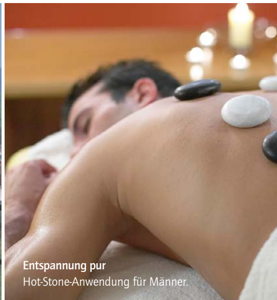
Entspannung pur Hot-Stone-Anwendung für Männer.